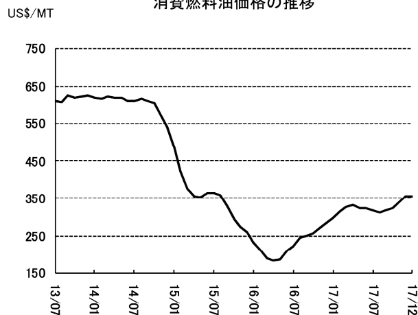
消費燃料油価格の推移