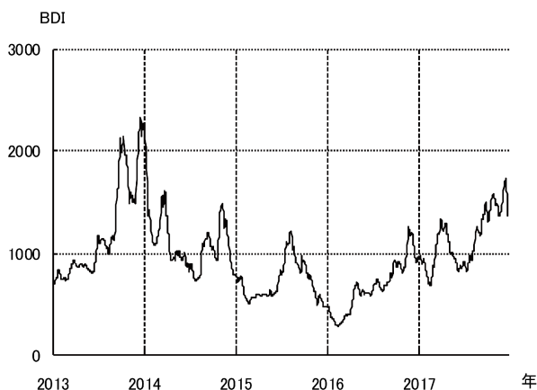
不定期船市況 BDI の推移

以上の結果、不定期専用船事業全体で業績は改善し、前年同四半期比増収となり利益を計上しました。