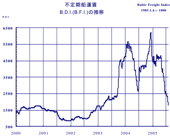
期間 2000/1 ~ 2005/7

原油タンカー、LPG船、LNG船等の長期安定契約船は、引き続き順調に稼働しましたが、全般的に市況が軟調に推移したため、部門全体として業績は前年同期を下回る結果となりました。