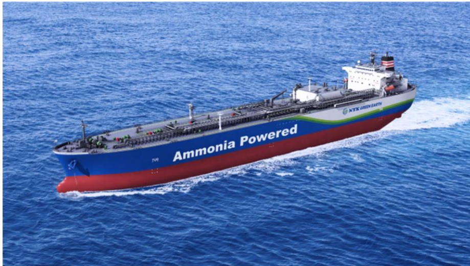
図-3 アンモニア燃料アンモニア輸送船(イメージ)