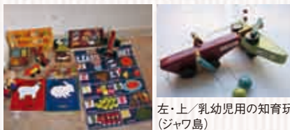
左・上/乳幼児用の知育玩具 (ジャワ島)