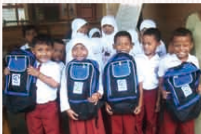
受け取ったランドセルと学用品に笑顔の子どもたち (スマトラ)