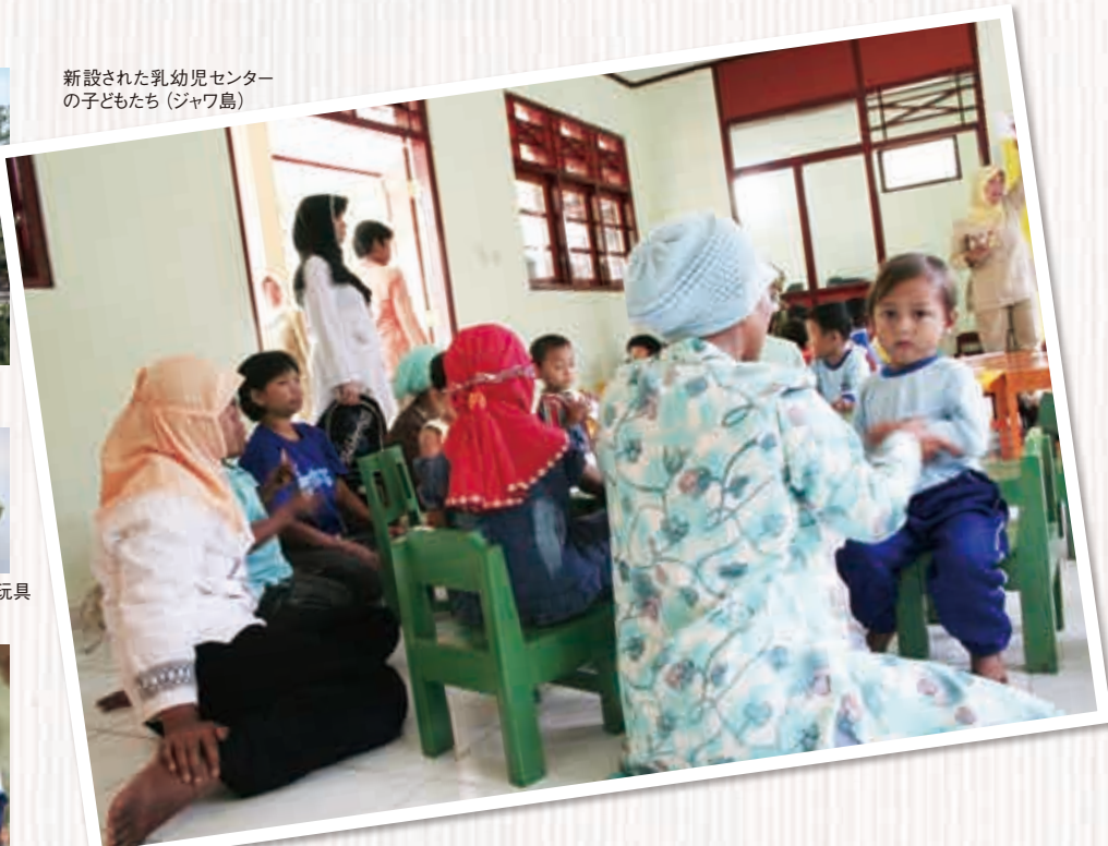
新設された乳幼児センターの子どもたち (ジャワ島)