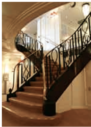
上／階段の手すりにあしらわれたアーチ型模様。船内各所で見られる