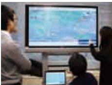
大画面を見ながら関係者で対応を相談

荒天で入港できないと判明した場合、船の速力を落として入港日を遅らせることにより、燃料消費量を削減できます。同システムは省エネルギーの面でも効果が期待できます。