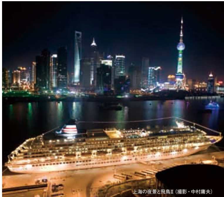
上海の夜景と飛鳥II

2011年10月、飛鳥クルーズは就航20周年を迎えます。これを記念して、さまざまな就航20周年記念クルーズを実施します。その一つが「ノスタルジック上海クルーズ」です。19世紀末から20世紀初頭、一攫千金を夢見て集まった世界中の人々を魅了した魔都・上海。当時、日本郵船は横浜〜上海間に日本初の海外定期航路を開き、長崎〜上海間に日華連絡航路を誕生させました。その航路をたどり、古き良き時代のノスタルジックな上海の面影を感じるクルーズです。さらに、上海航路全盛期のディナーメニューを復刻させ、上海雑技団観覧ツアーに乗客の皆様全員をご招待という、20周年記念特典をご用意しました。