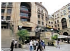
郵船のオフィスが入るビルとネルソン・マンデラ像

アパルトヘイト政策の廃止後は、大型ショッピングセンターが建設されるなど急速な経済発展を遂げた。今年開催されるサッカーW杯南ア大会の試合会場のうちエリス・パークとサッカー・シティの2カ所は同市内にある。街にはアパルトヘイト博物館などがあり、同国の歴史を学ぶこともできる。