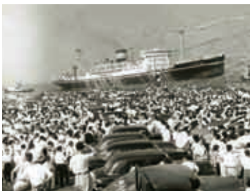
上／戦争への徴用から12年ぶりのシアトル航路への復帰は盛大に祝われた