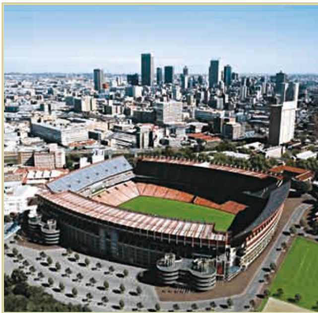
ヨハネスブルク中心部とエリス・パーク・スタジアム