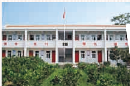
四川大地震で倒壊後、再建されたユエン・シャン小学校 (中国)