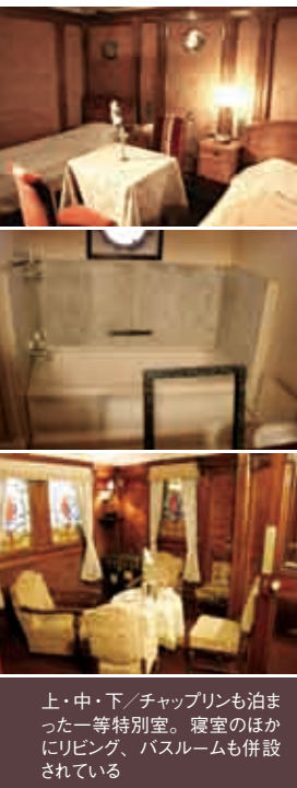
上・中・下/チャップリンも泊まった一等特別室。寢室のほかにリビング、バスルームも併設されている

シアトル航路に復帰した氷川丸には、米国と諸外国の相互理解を目的としたフルブライト留学生や高校生の交換留学を支援する非営利組織AFSの留学生も乗船した。これらの留学生には、2002年にノーベル物理学賞を受賞した小柴昌俊氏や2008年にノーベル化学賞を受賞した下村脩氏、「ミスター円」こと元大蔵省財務官の榊原英資氏など