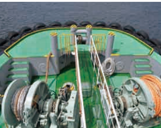
大きなウインチとウインドラス