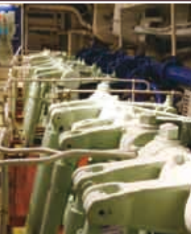
上／当時最新鋭のB&W製ディーゼル機関