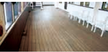
上／竣工当時のままの屋外デッキのチーク材の床。厚みは80年で5ミリしか減っていない 右／一等船客が読書や手紙を書いた一等読書室