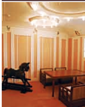
下／大人が社交室で会話や酒を楽しむの間、子どもたちはこのプレイルームで過ごした